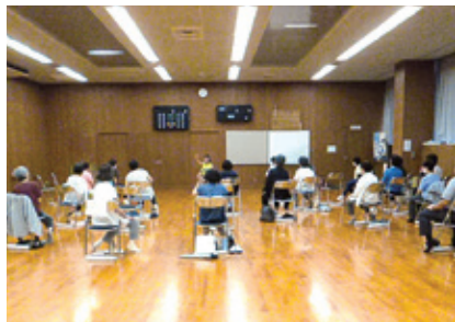
▲さくら学級の様子