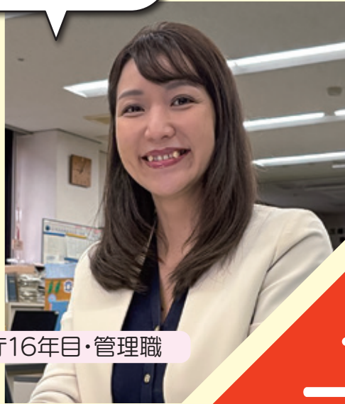
入庁16年目・管理職