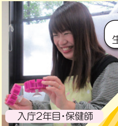
入庁2年目・保健師