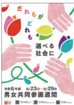
▲ 令和6年度のポスター