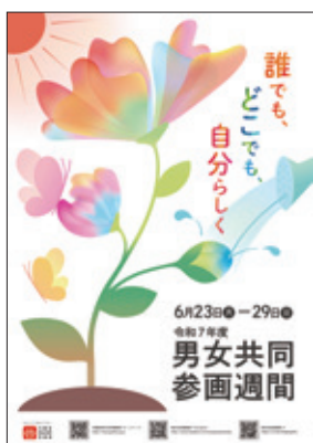
▲ 令和7年度のポスター