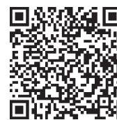
▲受診票申し込み はこちら