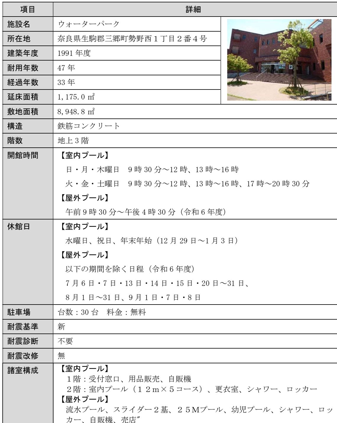
図表1 ウォーターパーク概要