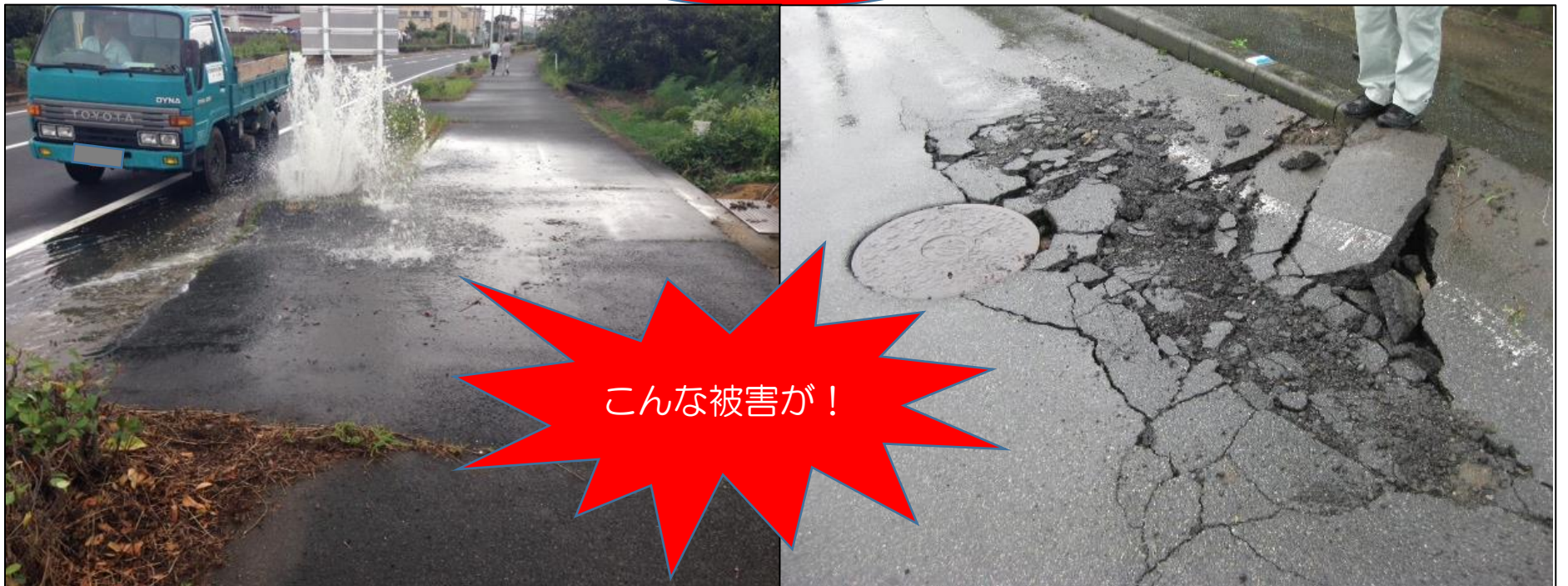
【マンホールからの下水噴出】