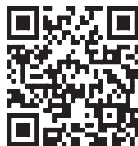
▲観光アプリQRコード