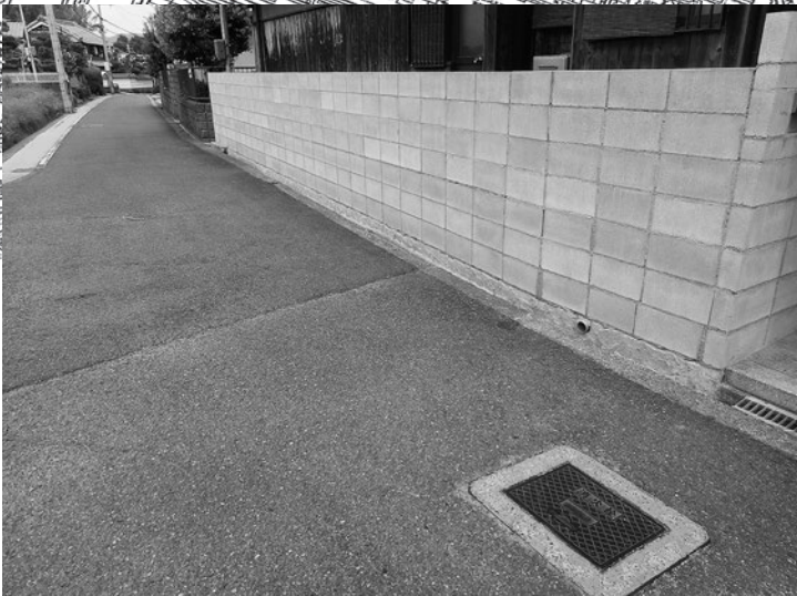
(※写真のブロック塀はイメージです)