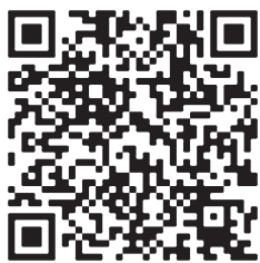
子ども情報ネット さんごう QRコード