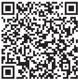
三郷町行政放送メール 配信サービス QRコード