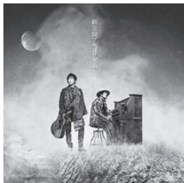
「新空間アルゴリズム」 スキマスイッチ