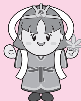
三郷町イメージキャラクター たつたひめ