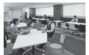
奈良サテライトオフィス35

平成28年12月には、JR三郷駅前に「奈良サテライトオフィス35」が完成し、ICTを活用した時間や空間にとらわれない働き方の拠点としてスタートしました。