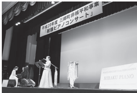
(昨年のコンサートの様子)