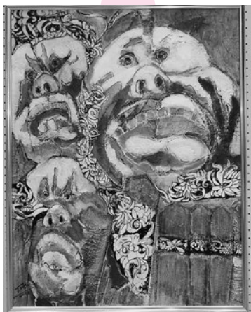
▲第30回美術展賞 受賞作品