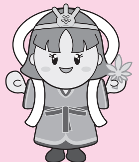
三郷町イメージキャラクター たつたひめ