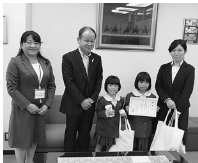
今年のテーマ「あいさつ」