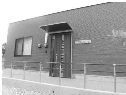
▲いちごルーム外観 (三郷町三室 1-14-2)