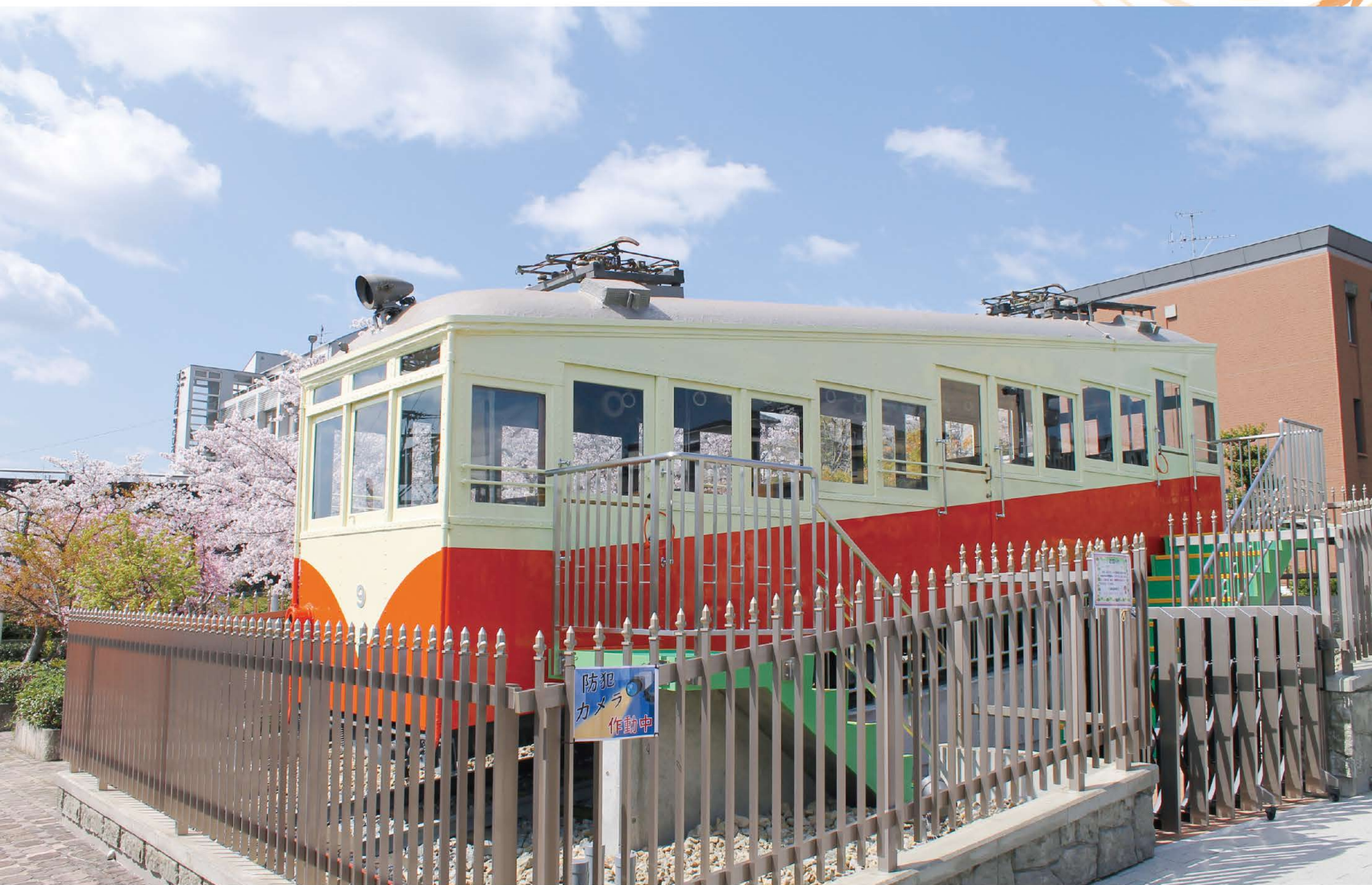
かつて駅舎のあった信貴山下駅前に帰ってきたケーブルカー

編集 奈良県生駒郡 三郷町議会 / 広報編集委員会・議会事務局 電話 (0745) 73-2101 (内線293) 直通 (0745) 43-7371