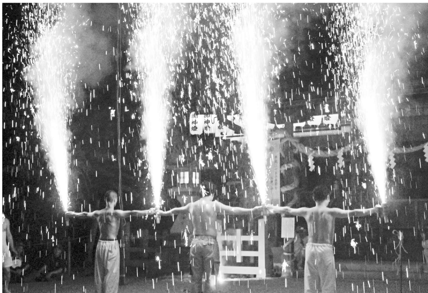
龍田大社 風鎮大祭

編集 奈良県生駒郡 三郷町議会／広報編集委員会・議会事務局 電話 (0745) 73-2101 (内線293) 直通 (0745) 43-7371