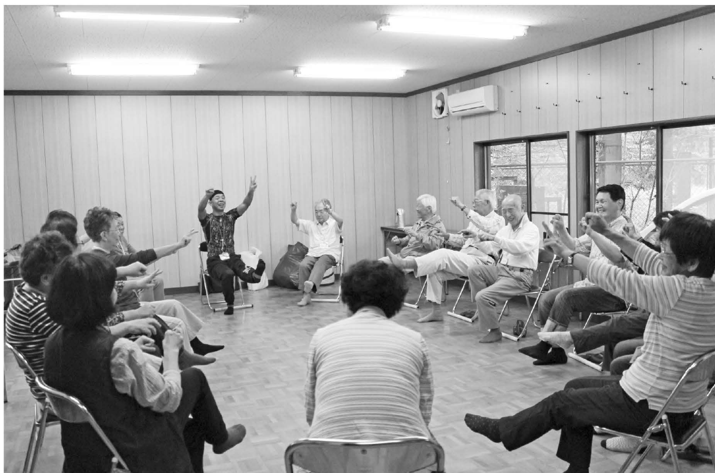
信貴山西町自治会館で行われたサテライト型スッキリ教室 (5ページに関連する一般質問を掲載しています)

編集 奈良県生駒郡 三郷町議会／広報編集委員会・議会事務局 電話 (0745) 73-2101 (内線293) 直通 (0745) 43-7371