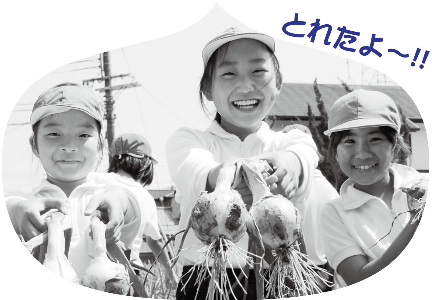
農業委員会の指導・協力のもと、三郷北小学校の5年生がたまねぎの収穫を行いました。

編集 奈良県生駒郡 三郷町議会／広報編集委員会・議会事務局 電話 (0745) 73-2101 (内線291) 直通 (0745) 43-7371