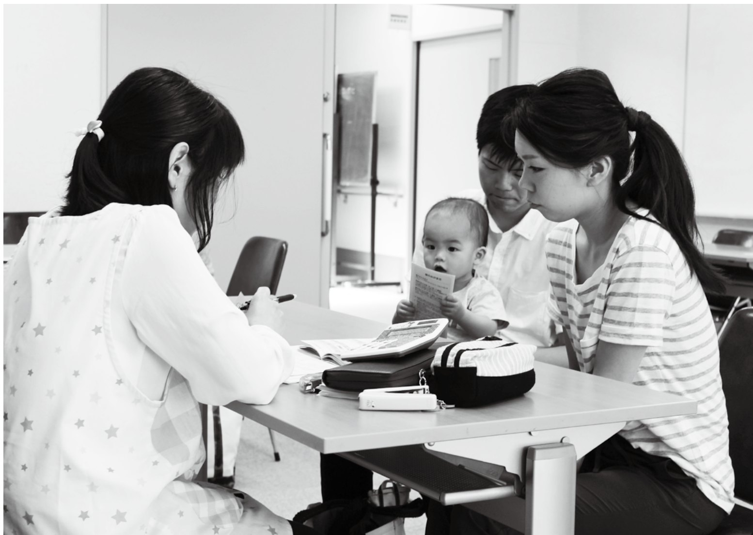
乳幼児健診での1コマ

編集 奈良県生駒郡 三郷町議会／広報編集委員会・議会事務局 電話 (0745) 73-2101 (内線291) 直通 (0745) 43-7371