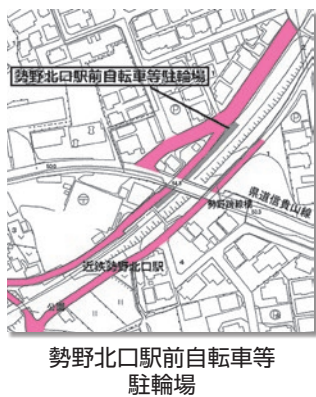
勢野北口駅前自転車等駐輪場