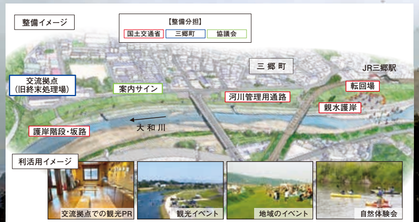
かわまちづくり事業イメージ