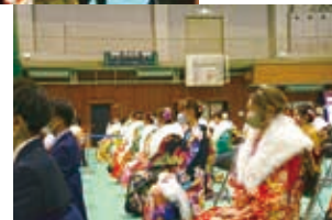
▲前回の成人式の様子