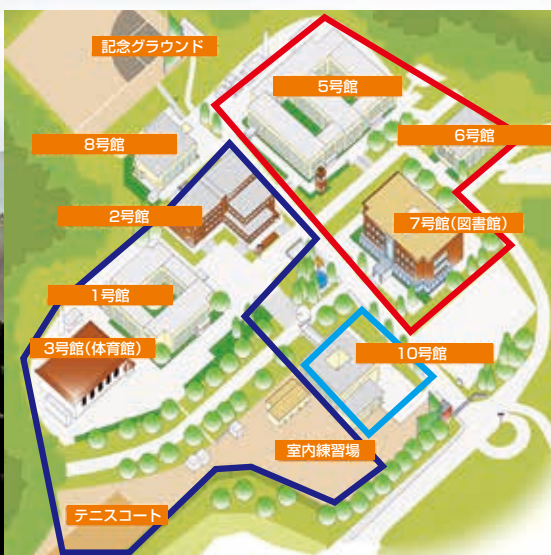
大学施設の位置図と各ゾーン

③年齢、国籍、人種、障がいの有無に関係なく、すべての方がイキイキと遊び、学び、働き、生活し、活躍し、交流する「ボードレスコミュニティ」の全世代・全員活躍型「生涯活躍のまち」をコンセプトに、奈良学園大学の跡地活