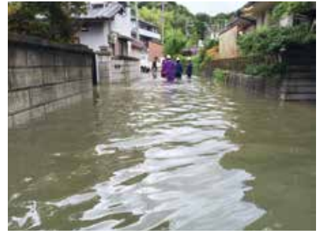
▲惣持寺地区浸水被害状況 (H26.8.9)