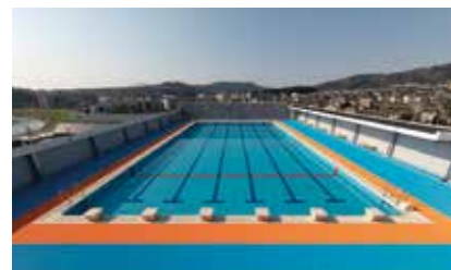
▲三郷中学校の屋上のプール