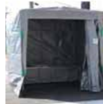
◀マンホールトイレ

マンホールトイレについては地域防災計画において、避難所等への整備に努めると明記しています。現在28か所整備しており、内訳は公共下水道接続型が14か所、汲み取り型が14か所です。中でも、三郷中学校の公共下水道接続型マンホールトイレは、断水時でも屋上のプールの水を排水に利用でき、汲み取り式では、大容量の貯留が可能です。 また災害時に必要となるトイレ数の推計は、避難者50人当たり1基必要と言われており、約130基必要と考えています。 大災害が発生し仮設トイレが到着するまでは、簡易トイレとマンホールトイレでの対応を余儀なくされます。 簡易トイレについては現在1万回分以上を備蓄しており、また住民の方にも常備していただくよう啓発していますが、今後にもさらに備蓄を充実させ、また指定避難所の施設改修にあわせて、マンホールトイレの整備を計画的に進め「災害に強いまちづくり」に努めてまいります。