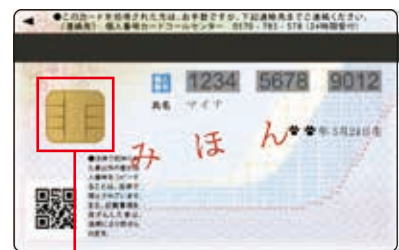
プライバシー性の 高い情報は入って いない

マイナンバーカードは顔写真が入っているため、対面での悪用はできません。また裏面のICチップには税や年金などのプライバシー性の高い情報は入っていません。もしマイナンバーカードを紛失してしまったとしても、暗証番号がないと使用できませんし、複数回、暗証番号を間違えると自動ロックがかかります。不正に情報を読み込もうとするとICチップが壊れる仕組みになっています。