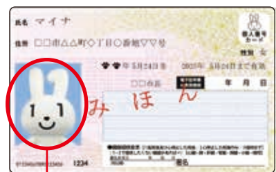
顔写真入りで 悪用されにくい