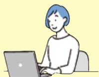
パソコンにて申請