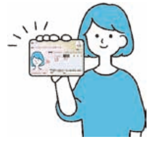
本人確認がすぐできる