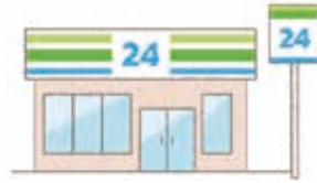
コンビニで住民票の写しなど 公的な証明書を取得できる (6:30~23:00)