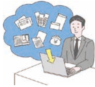
オンラインで 確定申告ができる