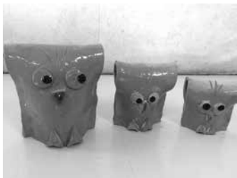
(三郷町子ども会連合会)