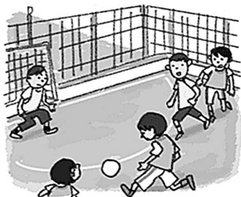
(生駒郡青少年指導員連絡協議会)