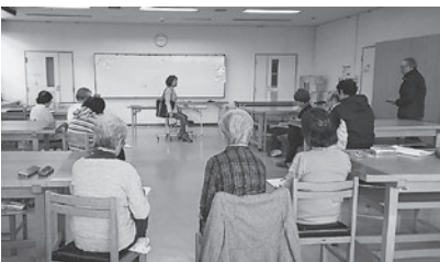
絵画教室(クロッキー風景)