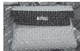
ジュエリーバッグ