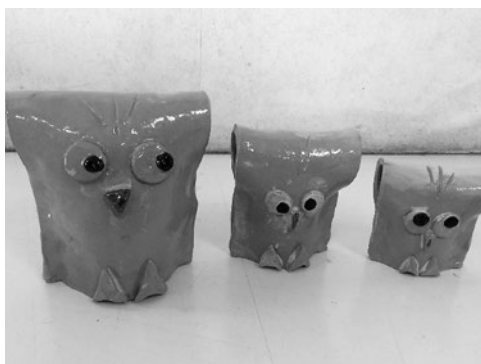
(三郷町子ども会連合会)