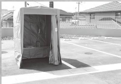
マンホールトイレを整備