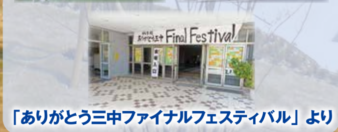
「ありがとう三中ファイナルフェスティバル」より