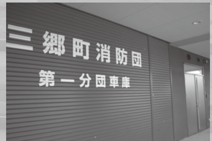
消防団第一分団屯所を併設

※その他、プールの水を被災時のマンホールトイレの排水として利用できるようにし、備蓄倉庫を整備すると共に、太陽光発電・蓄電池を設置しています。