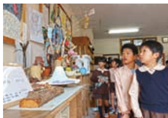
▲三郷小学校の3年生が交流に