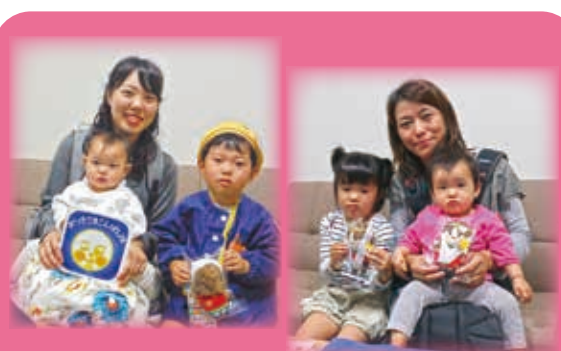
ブックスタートにいられた方からお祝いいただきました♪