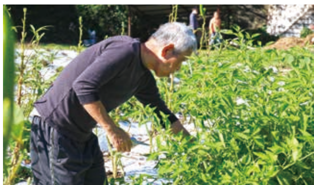
▲日中活動で農業体験