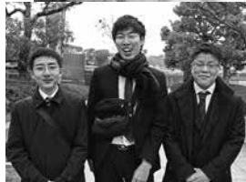
▲昨年の成人式の様子