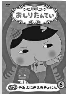
「おしりたんてい⑥」 80分