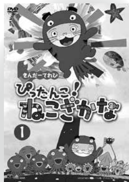
「ぴったんこ!ねごごかな①」 33分